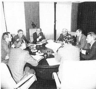
Intérieur de l'Hôtel provincial d'Anvers, situé à la Koningin Elisabethlei, 22-24, à Anvers.

Le bâtiment visible aujourd'hui a été terminé en 1920. On avait prévu une seconde aile qui ne fut pas réalisée.