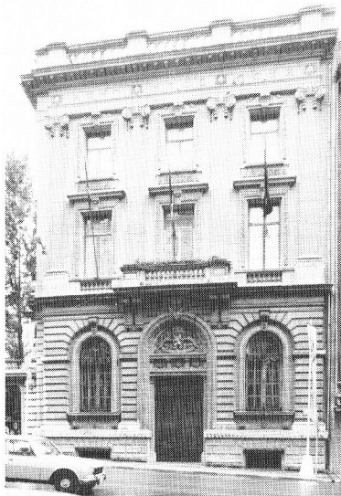
Hôtel du Gouvernement provincial de Brabant, 69, rue du Lombard, à Bruxelles. Œuvre de l'architecte P. Bonduelle.

Le bâtiment visible aujourd'hui a été terminé en 1920. On avait prévu une seconde aile qui ne fut pas réalisée.